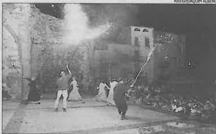
Espectacle de cloenda de la festa de l'any passat, amb Gog i Magog

La potenciació del vessant d'espectacles gràcies a la implicació de les entitats «és una mostra de la dimensió comarcal que ha anat adquirint la festa en aquests 15 anys», segons apunta l'alcalde d'Artés, Damià Casas, i és la línia que es vol